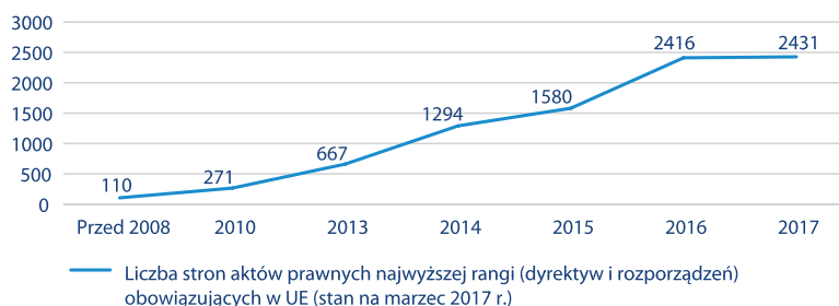
Rysunek 1. Liczba stron pokryzysowych regulacji bankowych (aktów prawnych oraz wniosków legislacyjnych) opublikowanych w Unii Europejskiej w latach 2010–2017